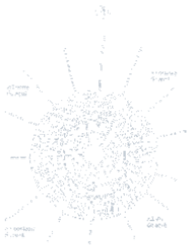
La rueda de los katunes

En este V centenario del "descubrimiento" de América son muy pocas las voces que han dicho algo sobre la tradición precolombina. Parecería que un prejuicio impidiera a los estudiosos de lo esotérico ocuparse de un tema que se presenta clarísimo respecto a la Cosmogonía Perenne. Eso, sin mencionar que lo esencialmente indígena ha quedado completamente de lado en las celebraciones, aunque se trate de aparentar lo contrario.