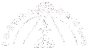
Diagrama que representa un eclipse de Sol

Chilam Balam , el profeta. Por lo tanto hoy es un día desafortunado."